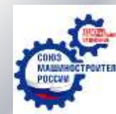
Тверское региональное отделение «СоюзМаш России»

Директор Института экономики и управления ТвГУ